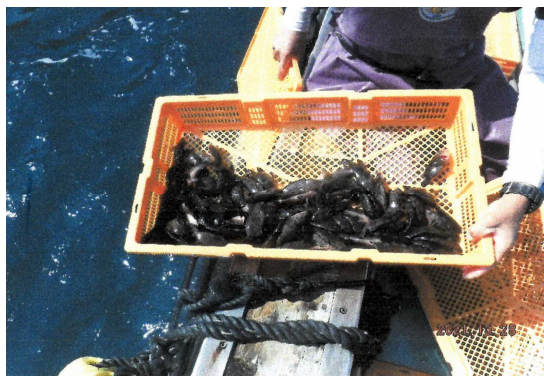
種苗放流(キジハタ)