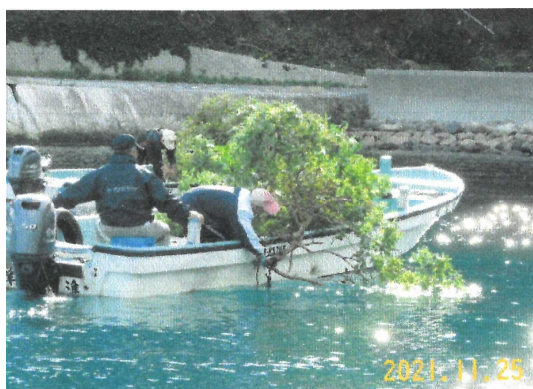
産卵場の整備(産卵礁の設置)