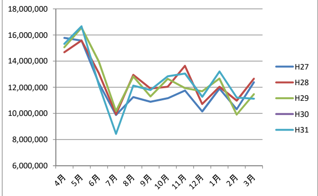
売上額 月別推移(円)