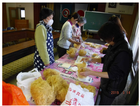
高付加価値化（天草）