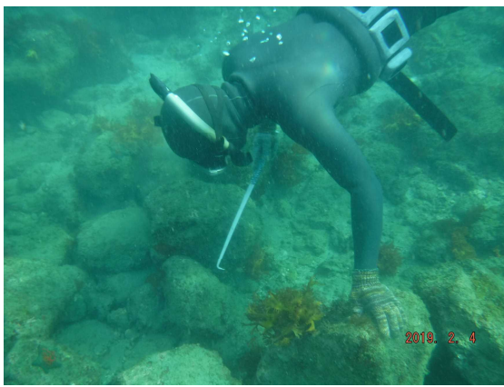
漁場の管理・改善（ガンガゼ駆除）