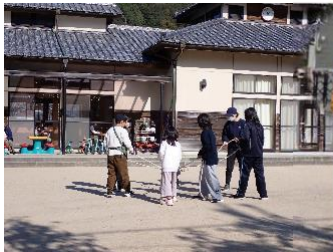
地域とのあたたかい繋がり