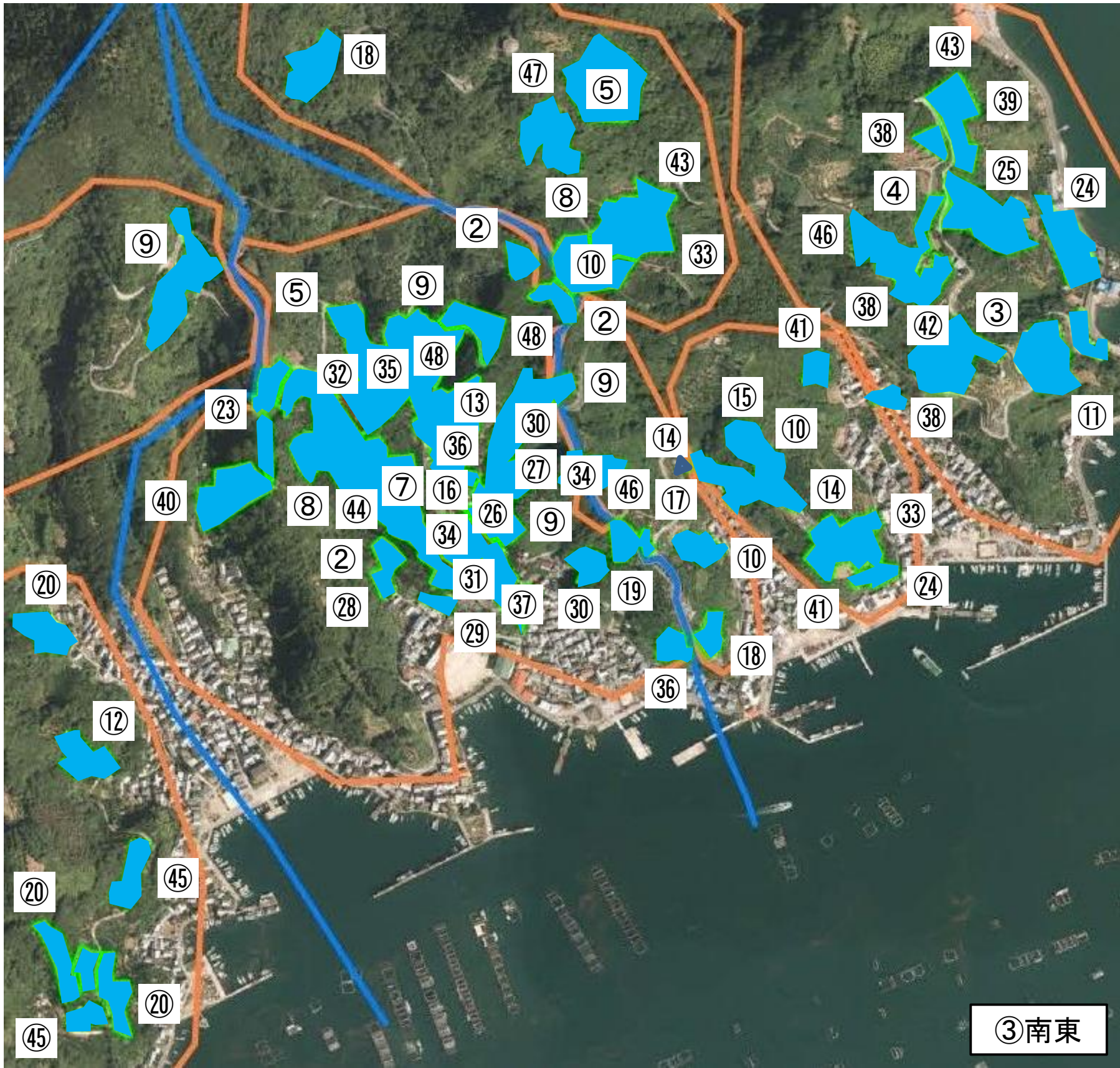
おおむね10年後の意向