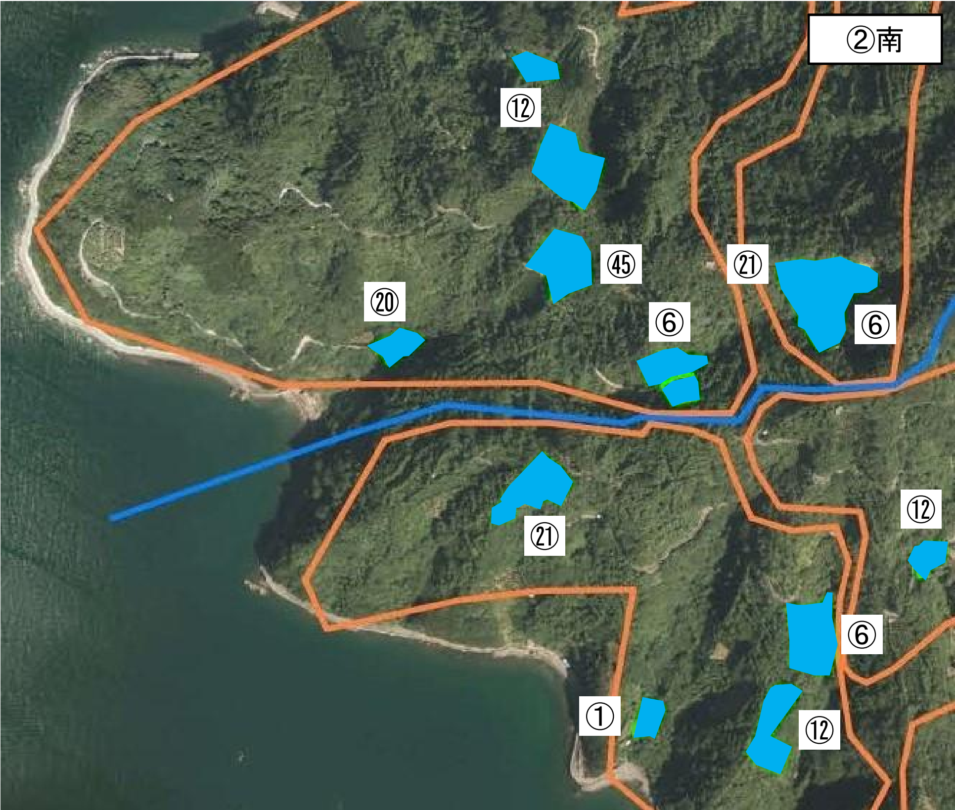
おおむね10年後の意向