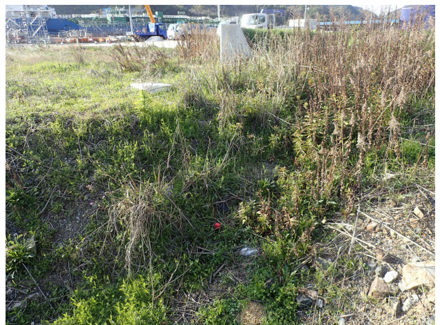
2 3 N-②