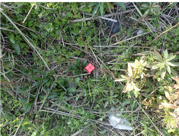
2 3 N-①