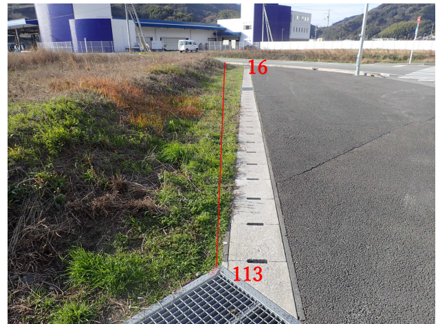
1 1 3 (→1 6)