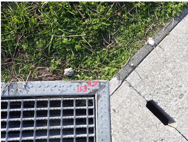
1 1 3