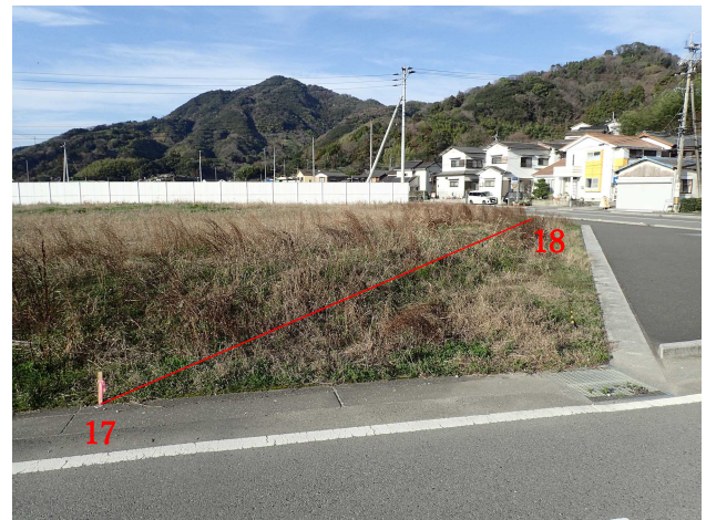
1 7 (→1 8)