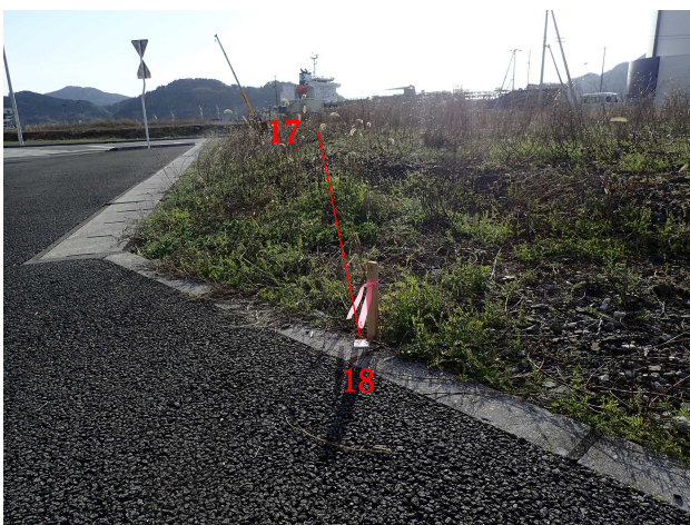
1 8 (→1 7)