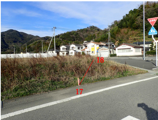
1 7 (→1 8)