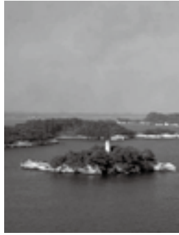
松島四大観(松島町・ 東松島市・七ヶ浜町)