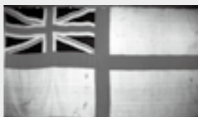
「英国軍艦旗」 (公益財団法人宇和島伊達文化保存会蔵)

■秋まで待てないダテ話① 「パークス来宇150年」 9月に予定している秋期特別展について、少しでもご紹介いたします。 今年から数えて150年