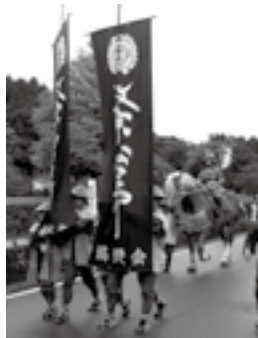
政宗公まつり (大崎市 9月)

※今回紹介した観光地などの詳しい情報や、宮城県のそのほかの観光情報については、公益社団法人 宮城県観光連盟ホームページ「宮城まるごと探訪」( http://www.miyagi-kankou.or.jp/ )をご覧ください。