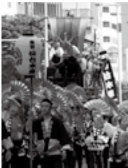
仙台青葉まつり (仙台市 5月)