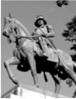
仙台城跡〈青葉城址〉 (仙台市)