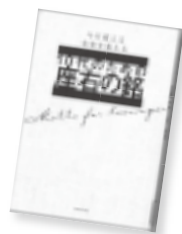
10代のための座右の銘 大泉書店編集部 / 編

いよいよ18歳選挙権導入へ。教育現場に求められる主権者教育とは？高校生も選挙活動をしてもいいの？メリット・デメリットは？18歳以下の未成年者に選挙権を行使する際の必要な知識と実践をQ & A形式で解説する。