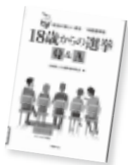
18歳からの選挙Q & A 全国民主主義教育研究会 / 編

いよいよ18歳選挙権導入へ。教育現場に求められる主権者教育とは？高校生も選挙活動をしてもいいの？メリット・デメリットは？18歳以下の未成年者に選挙権を行使する際の必要な知識と実践をQ & A形式で解説する。