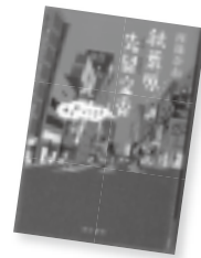
秋葉原先留交番ゆうれい付き 西條 奈加 / 著

「さきどまり」という名の交番に勤める榎田は、秋葉原をこよなく愛するオタク。コンビを組む向谷はコミュニケーション能力の高さがこうじて、足だけの幽霊を連れてきて…！？電気街の路地裏に隠された5つの人情ミステリー。