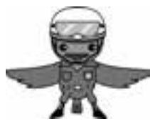
こまっち えひめ防災 マスコット キャラクター