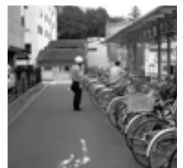
通行の支障となる迷惑駐輪

路上放置自転車などを一斉撤去(月間中) 「道路ふれあい月間」運動の一環として、道路に放置されている自転車などを各道路管理者が一斉に撤去します。 月間中(8月1日～31日)に実施する予定ですので、自転車などを路上に放置している人は、それまでに自宅へ移動・保管してください。 詳しくは、お問い合わせください。