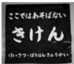
この旗のある所では遊ばない

子どもの健やかな成長は、家族や地域全体の願いです。家庭だけでなく地域も一体となって守り育てましょう。