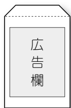
角形2号封筒 縦250mm ×横210mm