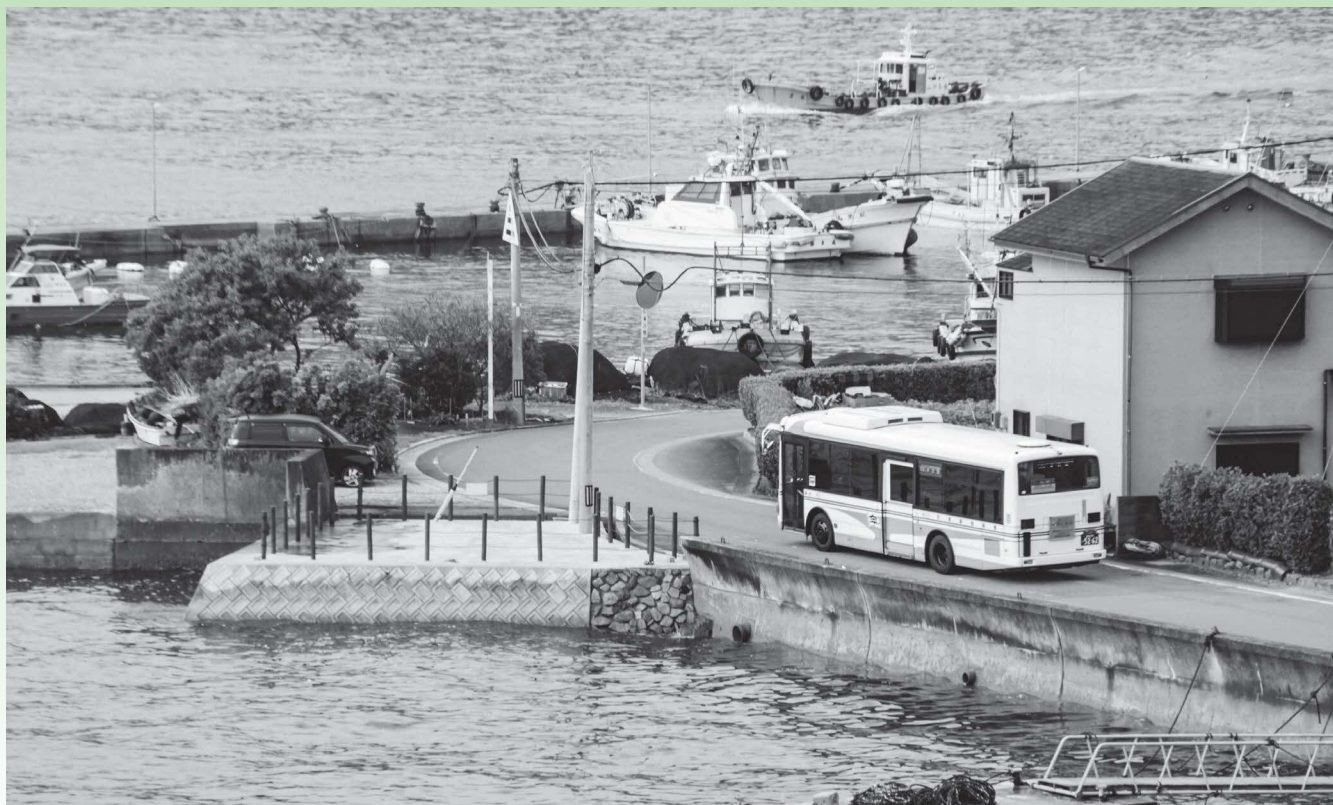
宇和島百景～狭い道でもススイ～