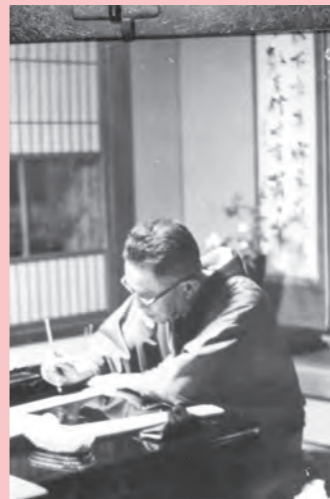
大畑旅館で執筆する獅子文六

そのほかにも、岩松滞在中の取材を生かした小説として「娘と私」「大番」等があります。