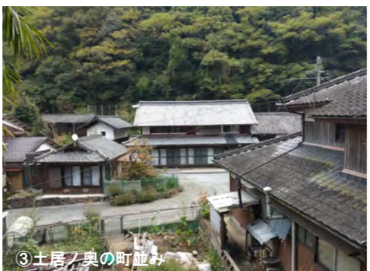
③土居ノ奥の町並み