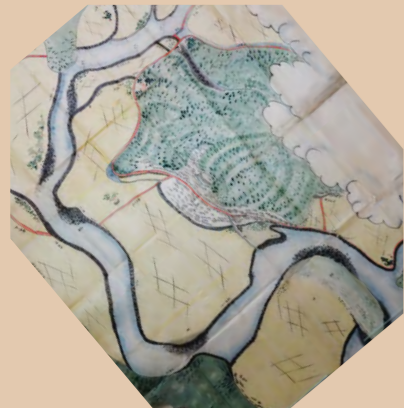
津島町岩松付近之図 (慶応2年以前)

岩松川の河川付替 小西家が宇和島藩に新田開発と治水を目的に届出を行い、慶応2年に岩松川を現在の流れに付替えました。