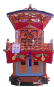
魚棚2丁目 / 太閤秀吉