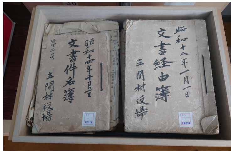
旧立間村文書の一部

また、令和6年5月20日には、立間公民館にて、指定書の授与式と報道機関の方へ資料公開が行われました。