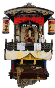
本町1丁目 / 関羽