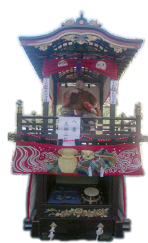
魚棚3丁目 / 恵比須