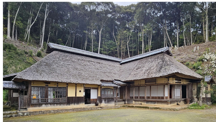
旧毛利家庄屋住宅

今後は、「旧庄屋毛利家を守る会」の活動を支援、会の協力を得ながら、一層の保存活用を図っていきます。なお、毛利家より今後の維持管理経費の一助として1千万円の寄附もいただきました。