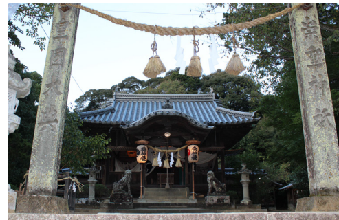
吉田町立間の八幡神社

『吉田祭のお練り行事』は、江戸時代からの町人による氏子主体の祭礼組織が現在まで維持されていることや、典型的な江戸時代の大名祭りともいえる都市祭礼が継承されていること、また、勇壮な「牛鬼」や躍動感あふれる「鹿踊り」といった愛媛県南部、南予地方独特の祭礼文化の要素が広範に含まれて構成され、運行する団体や組織とあわせて、時代を超えて今に継承されているという伝承性が強くみられる特色を有しています。