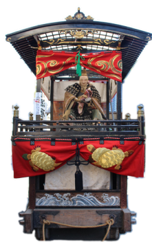
裏町1丁目 / 武内宿禰