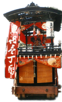
魚棚1丁目 / 八幡太郎義家