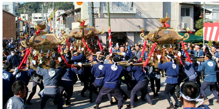
桜橋での神輿3体の飛び込み

【吉田祭礼絵巻(利根翠塙模写本)】一部加工、1835(天保6)年の絵巻を1917(大正6)年写したものとされています。