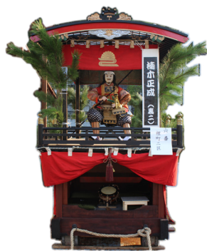
裏町2丁目 / 楠木正成