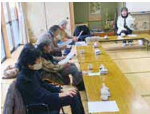
講師を迎え、「歌の時間」を楽しみました♪