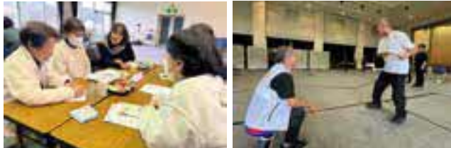
はじめての傾聴講座