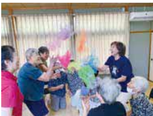
ミュージックケアではたくさん笑いも！

宇和島市社会福祉協議会では、“ふれあい・いきいきサロン活動”をはじめ、地域の多様な通いの場づくりを推進しています。「サロンに興味がある」「集いの場をつくりたい」という方は、地域福祉課（☎0895-23-3711）までお気軽にお問い合わせください。