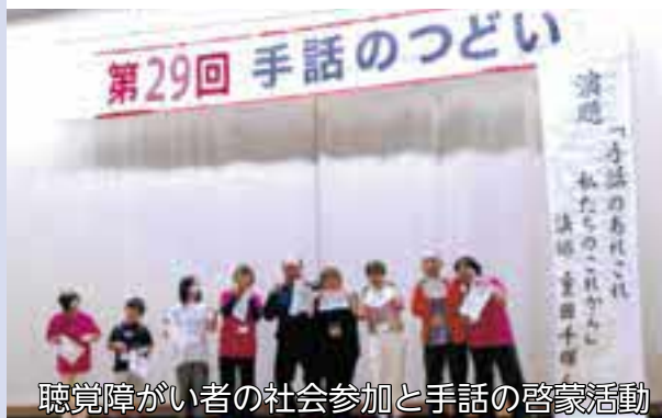
聴覚障がい者の社会参加と手話の啓蒙活動