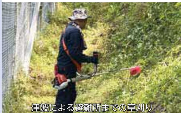
津波による避難所までの草刈り