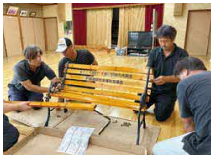
戸島地区。ベンチ組み立ての様子。