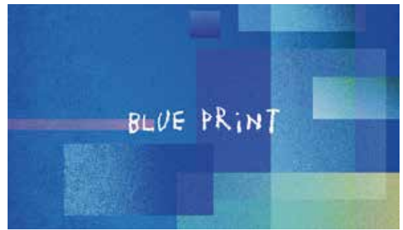
ID : 0107395