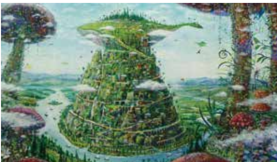
ID : 0098717