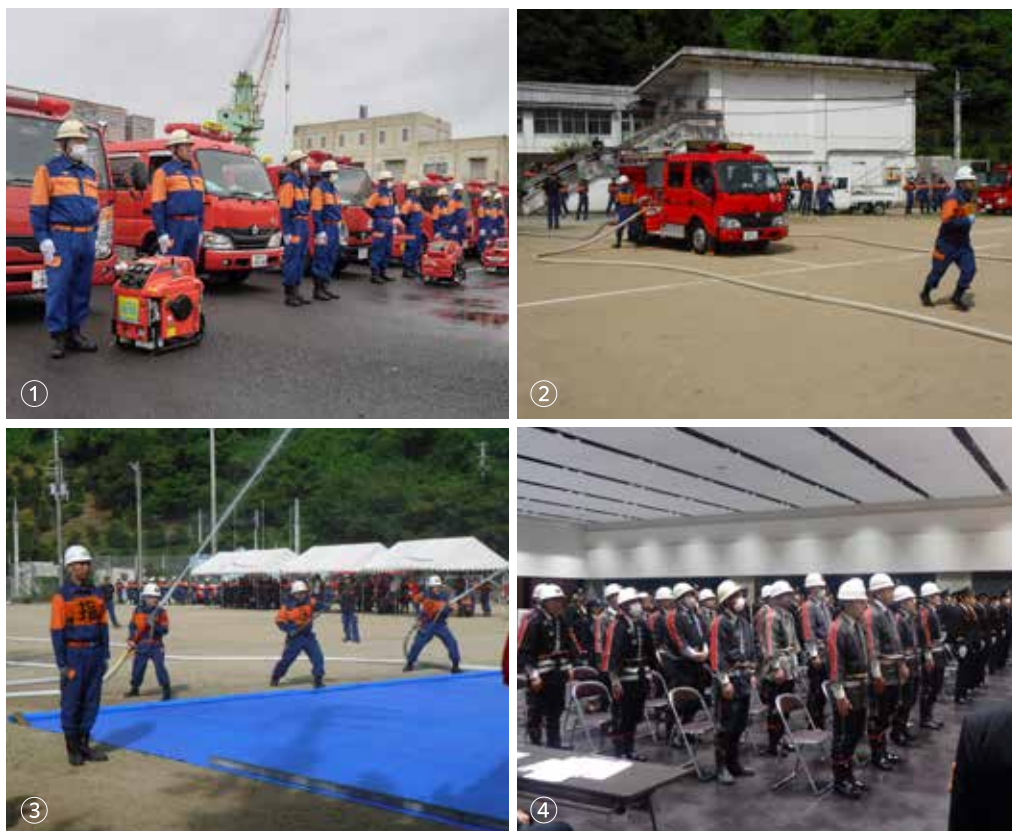
①全団員の半数が一堂に集まる出初式。②③消火活動の基礎（指揮、規律、機械器具の取り扱い）を身に付ける操法訓練。④新たな団員を迎え退団者を送る消防団入退団式。