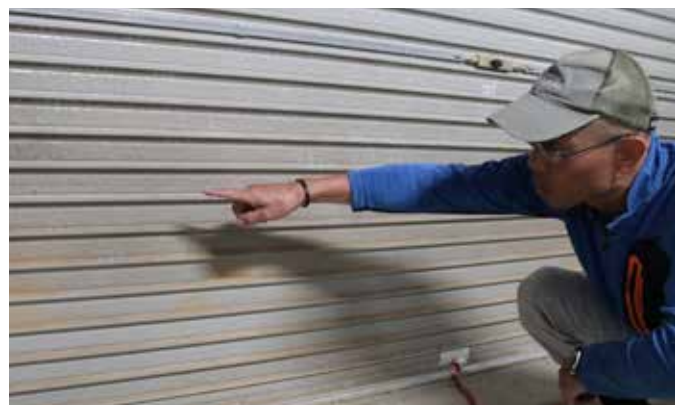
現在は補修された、平成30年7月豪雨で氾濫した自宅近くの川。土砂が流入し浸水した跡がシャッターに残っている。