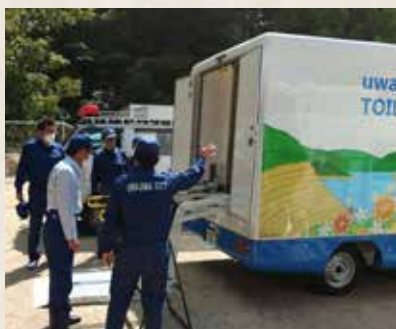
▲愛媛県総合防災訓練の様子

後同じような事態が起きようとも決してパニックに陥ることなく、またSNSなどでの悪質なデマや根拠のないうわさの拡散は絶対に控え、冷静に日常生活を送ってください。そして普段から食料・水を備蓄し家具を固定するなど、来たるべき事態に向けて着実に準備を整えてください。 市では関係機関と連携した上で、非常事態に即応できる体制を構築することに努めていきます。