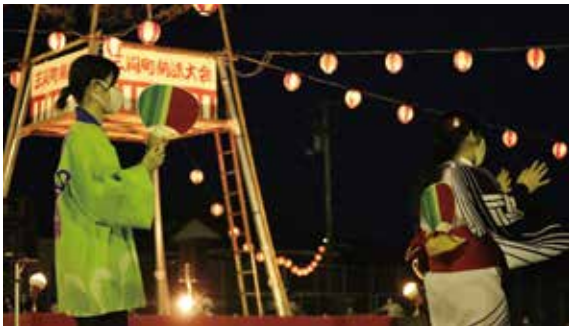
ID : 0103554