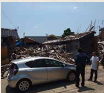
▲奥能登地域視察の様子

令和6年がスタートして半年が経過しました。これまでを振り返ると、新年へと暦が変わってわずか16時間後に「能登半島地震」が発生しました。また4月には本市でも「豊後水道を震源とする地震」が発生し、改めて将来発生するだろう南海トラフ地震への意識を高めるきっかけともなりました。 このような背景の下、先日、奥能登地域を視察する機会があり、輪島市、珠洲市の被災状況を目の当たりにしました。片側通行である高速道路の路面はうねり、現場に近づくにつれブルーシートで屋根が覆われた家屋が目立ちました。両市ともに、まずは市民の暮らしを確保するため仮設住宅の建設を進め、併せて被災家屋の公費解体に取り組んでいました。この解体に