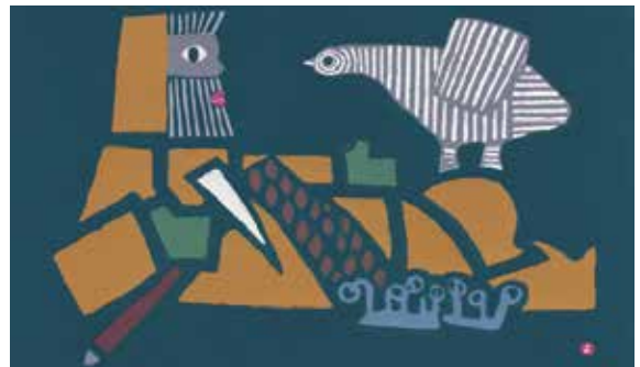
ID : 0100972