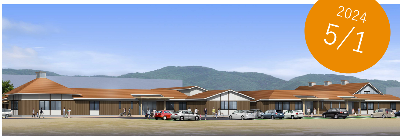
宇和島市はぐくみサポートステーション完成予想図