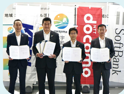
▲令和6年3月26日協定式（集合写真）

※「デジタル相談窓口」は、上記連携事項のうちデジタルデバイドの解消に関することに基づく取り組みです。