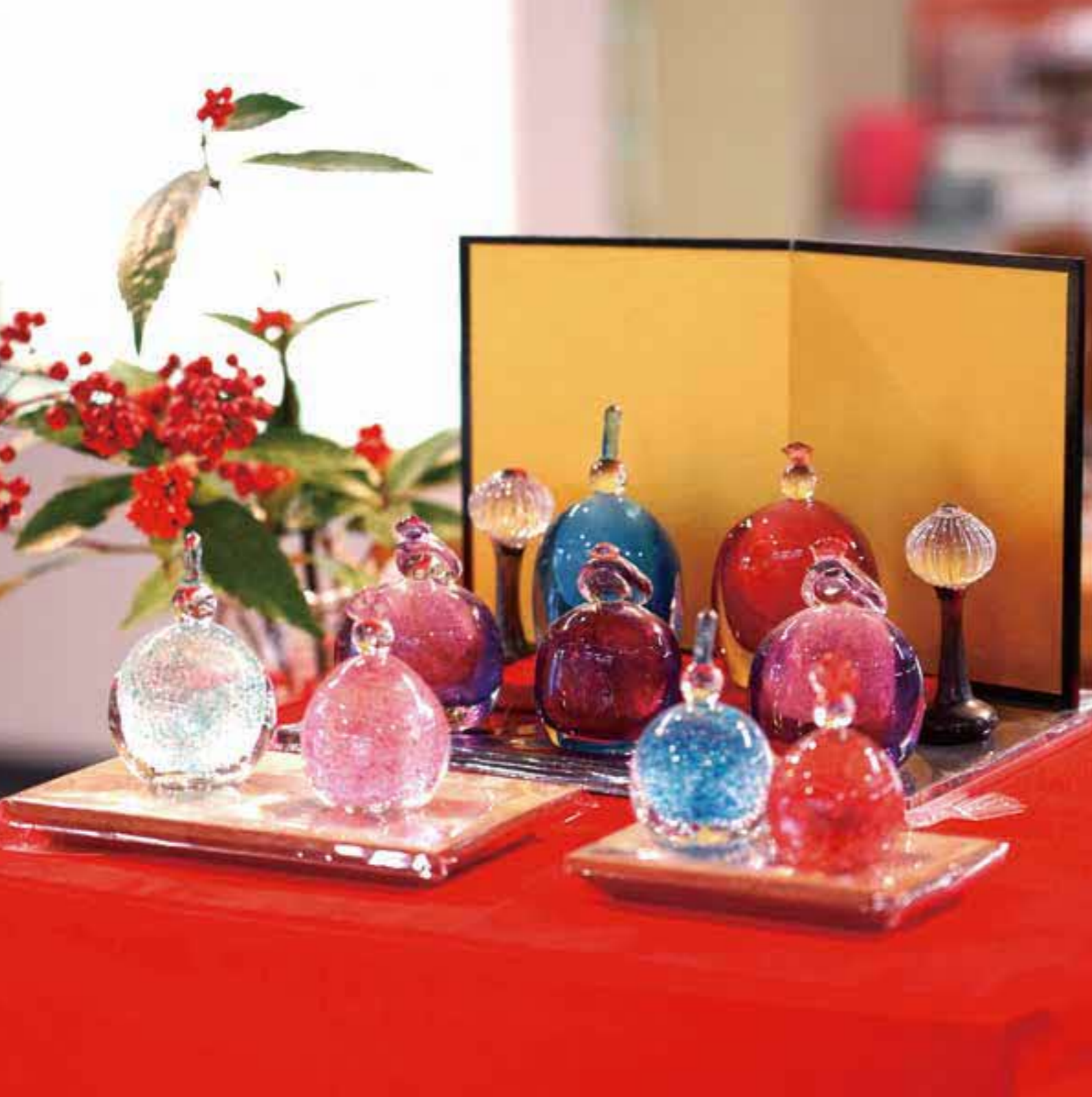
ひな人形 (松野町・ガラス工房)