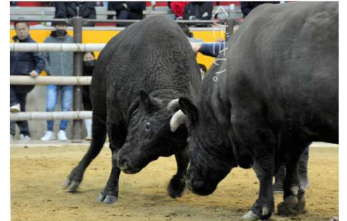
宇和島市営闘牛場で行われた宇和島闘牛正月場所。巨体が激しくぶつかり合い、観客を沸かせた=1月2日午後、宇和島市和霊町

今後、牛の数が増えれば年5回への復帰も検討する。定期大会のうち、4月に予定していた春