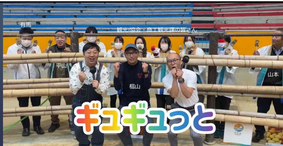
闘牛場にて、パブリシティー対応の様子