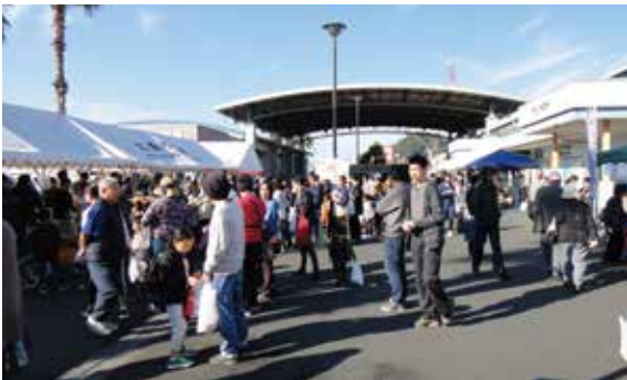
ID : 0083746