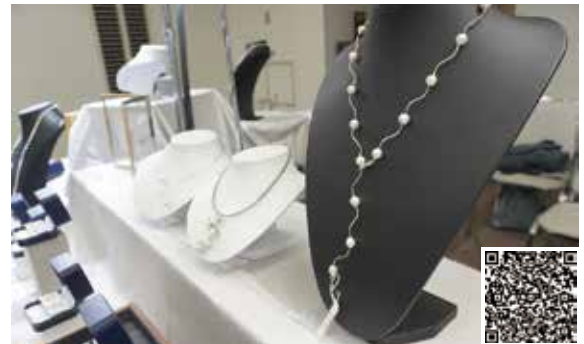
ID : 0083533