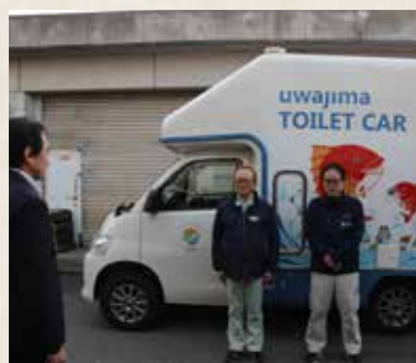
▲トイレカー派遣出発式の様子

令和5年最後の公務は、消防団による年末特別警戒の巡視でした。この警戒は、冬期で空気が乾燥し暖房器具など火を取り扱う機会が多く、火災が発生しやすい年末の時期に消防団が実施するものです。本市は大変広い面積を有していることから、年末の数日間市長、副市長をはじめ担当管理職それぞれ担当区域を定め、全域を巡視します。そこで今回も目にした団員の顔は、皆さん使命感にあふれ、この地域を自分たちが守っていくんだという気持ちで伝わってきました。