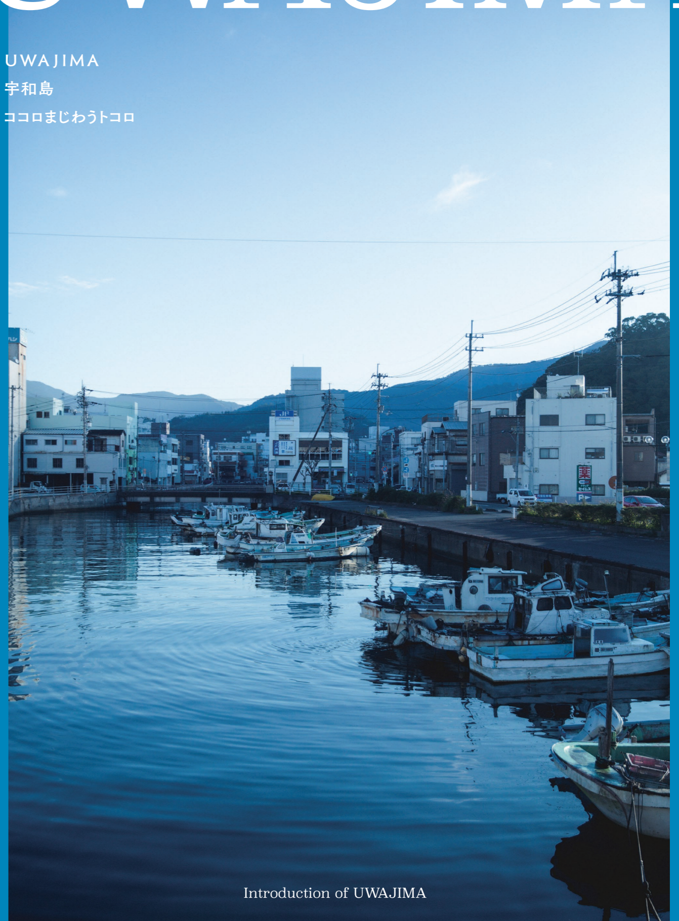
Introduction of UWAJIMA