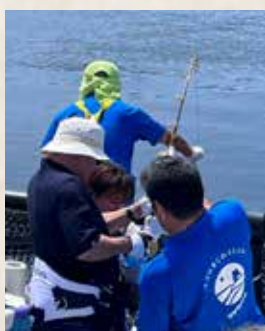
▲一本釣り体験の様子

かねてより本市で生産される養殖魚は高く評価され、また、時に行われる現場体験は、これまで経験したことのない観光メニューとして人気を博しています。しかし、その実施については、早朝から現場は動き、そもそも人材不足である養殖関係者は多忙を極めていることやタイムミングの問題など、クリアしなければならぬ課題があります。このような状況の下、先日、南予各地を巡るツアーがPRを兼ねて開催され、そのメニューの一つとして、マグロ養殖場での一本釣り体験が実施されました。