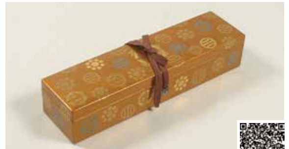
梨子地御紋散蒔絵目録箱 (公財) 宇和島伊達文化保存会蔵