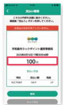
③支払い金額を入力する