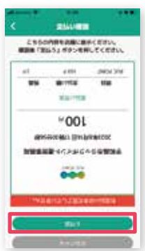
④金額を入力した画面を 店員に見せて、支払う をタップ