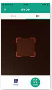
②「QR読取」をタップし、QRコード を読み取る