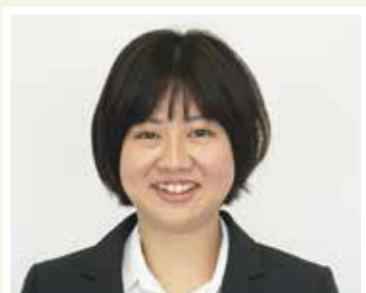
②大車 苑花(岩松保育園)