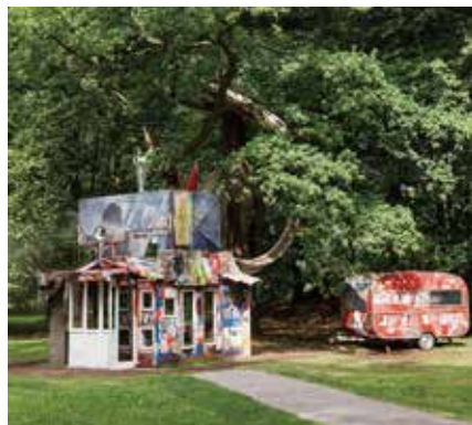
《モンシェリー:スクラップ小屋としての自画像》2012年 Commissioned by DOCUMENTA(13)