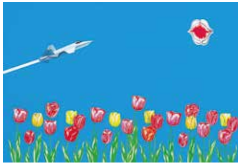
《ひねもす叫び 新宿／新潟／熊本》1999年