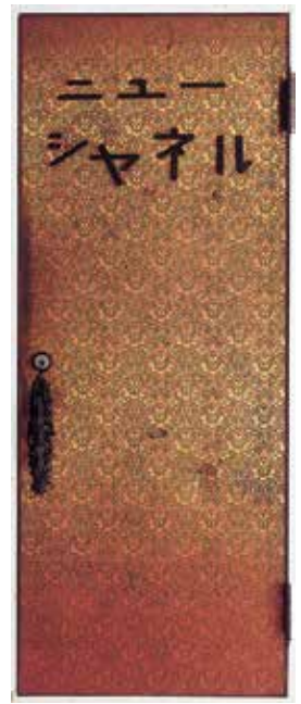
《ニューシャネル》1998年