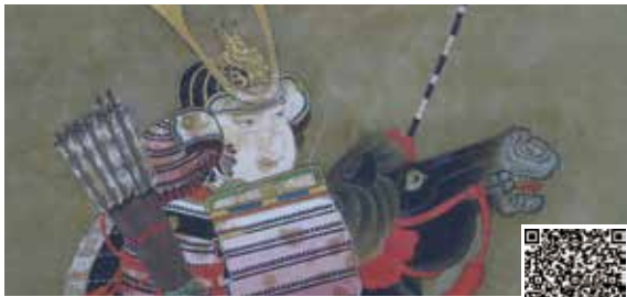
義経牟禮高松図 英一蝶筆(部分) [(公財) 宇和島伊達文化保存会蔵]