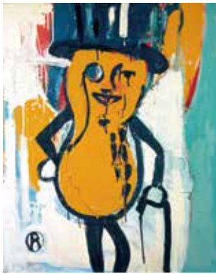
《ミスター・ピーナッツ》 1978-81年 個人蔵