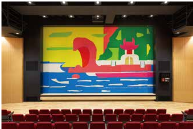
《のぞき岩》(「パフィオウわじま」ホール緞帳作品) 2019年

テント膜作品の設置期間は2023年10月31日(火) (予定) までに変更となりました。詳細は未来へつなぐ道後まちづくり実行委員会事務局 (松山市道後温泉事務所内) ☎089-921-6464までお問い合わせください。