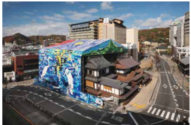
《熱景 / NETSU-KEI》(道後温泉本館素屋根テント膜作品) 2021年 © Shinro Ohtake / dogo2021

大竹文庫で配布しているブックリスト(期間中限定スタンプ入り)を持参すると、入場料が割引になります。