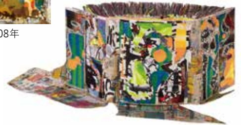
《スクラップブック #71 / 宇和島》 2018-21年 Photo : 岡野圭