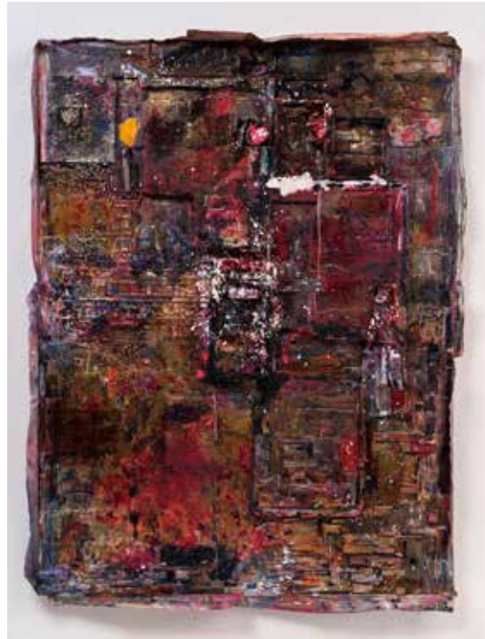
《残景 0》2022年

1955年東京都生まれ。愛媛県宇和島市在住。主な個展に熊本市現代美術館／水戸芸術館現代美術ギャラリー(2019)、パラソルユニット現代美術財団(2014)、高松市美術館(2013)、丸亀市猪熊弦一郎現代美術館(2013)、アートソングセンター(2012)、広島市現代美術館／福岡市美術館(2007)、東京都現代美術館(2006)など。また国立国際美術館(2018)、ニュー・ミュージアム・オブ・コンテンポラリー・アート(2016)、バービカン・センター(2016)などの企画展に出展。ハワイ・トリエンナーレ(2022)、アジア・パシフィック・トリエンナーレ(2018)、横浜トリエンナーレ(2014)、ヴェネチア・ビエンナーレ(2013)、ドクメンタ(2012)、光州ビエンナーレ(2010)、瀬戸内国際芸術祭(2010、13、16、19、22)など多数の国際展に参加。また「アゲインスト・ネイチャー」(1989)、「キャビネット・オブ・サインズ」(1991)など歴史的に重要な展覧会にも多く参加している。