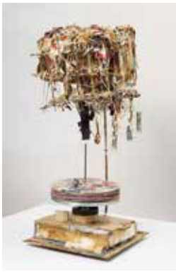
《時憶／フィードバック》 2015年