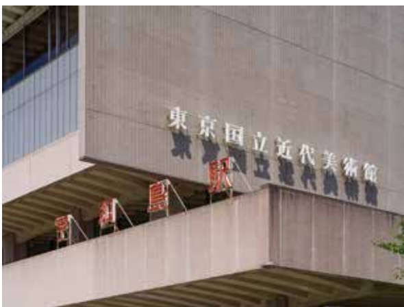
《宇和島駅》1997年

館）にも設置したんですけど、近美は1969年に建てられた昭和建築の代表作のようなもので、その昭和の建築と宇和島駅がこれまの中でベストマッチだと感じました。今回近美にこれを取り付けるために今まで宇和島で過ごして来たのかなと思えるくらいに。宇和島駅が自分の家族のように見えた。冗談だけど、美術館の中が空っぽでもいいんじゃないかと思うくらい、今回の展覧会で自分がやりたいことのすべてを言い得ているなど、はつきり意識しました。あれこそ「既にそこにあるもの」つていうか。