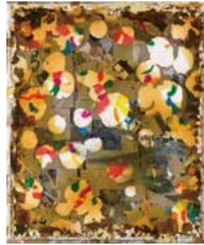
《芥子／音影II》2008年 愛媛県美術館