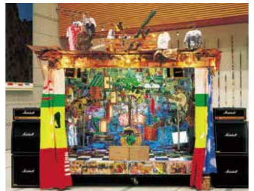
《ダブ平&ニューシャネル》1999年 公益財団法人 福武財団