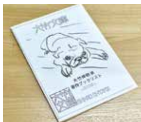
表紙絵が変わりました

大竹文庫で配布しているブックリスト(期間中限定スタンプ入り)を持参すると、入場料が割引になります。