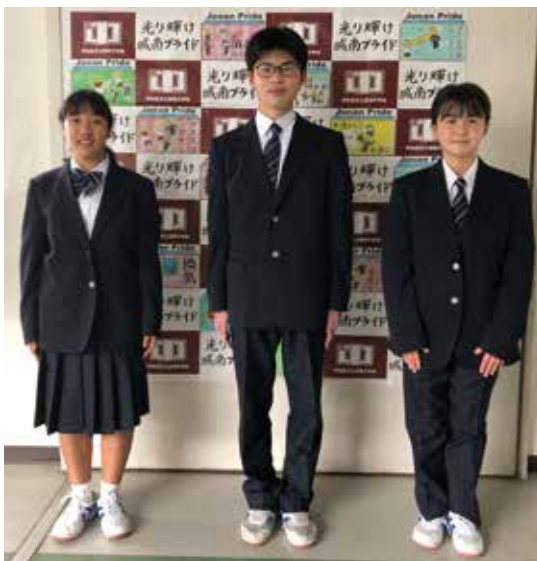
城南中学校新制服