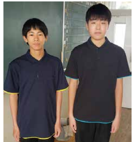
吉田中学校新夏服