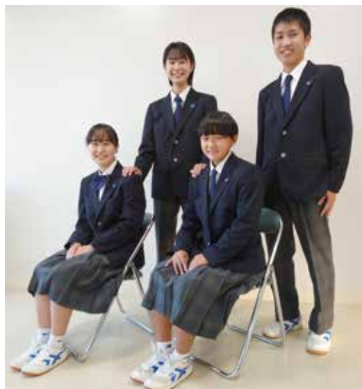
城東中学校新制服