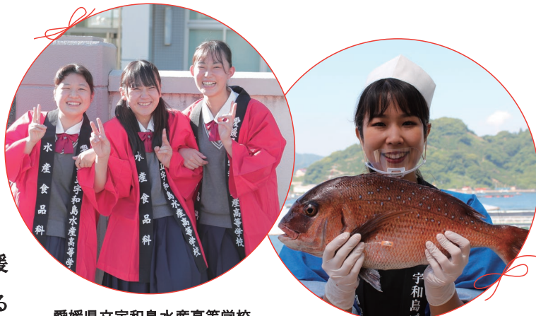
愛媛県立宇和島水産高等学校 3年生フィッシュガール

また(株)宇和島プロジェクトのサバキ女子として、フィッシュガールと同様に解体ショーなどで活躍している