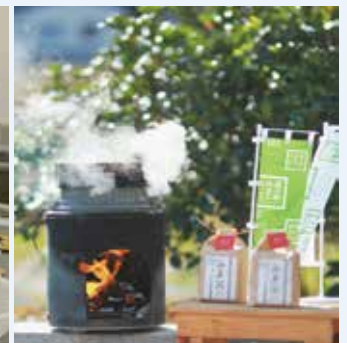
▲道の駅みま (かまどで炊くみま米)