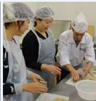
▲安岡蒲鉾本社工場 (じゃこ天作り)