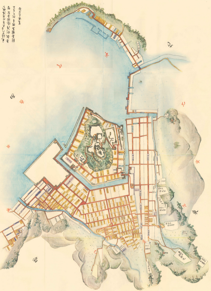
元禄16年宇和島城下絵図(公財)宇和島伊達文化保存会蔵

また、石垣については、高虎から伊達家のもので新旧さまざまな積み方を見ることができます。