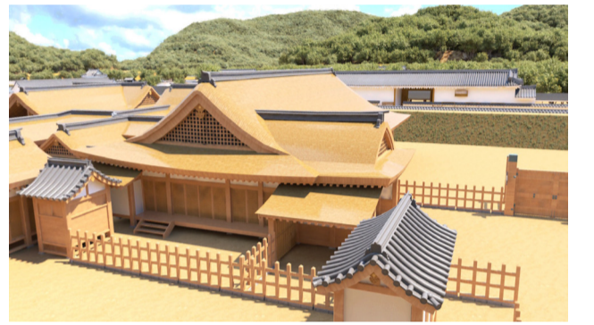
三之丸御殿再現 CG(VR宇和島城より)

(1863)年には取り壊され、調練場として使われました。近代以降、堀は埋められて市街化し、目に見える遺構は山裾の石垣のみになりました。