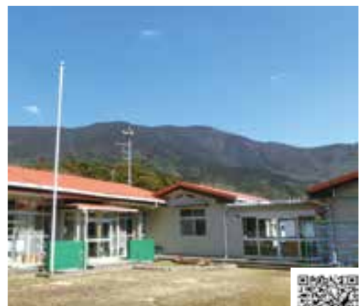
【みまきガーデン内園から撮影】