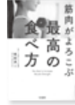
筋肉がよるこぶ最高の食べ方

こどもと一緒に動物たちを、こちょこちょすると、動物たちが大笑い。ところが、らいおんさんは…。こどもが大笑いする参加型絵本。