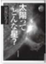
太陽ってどんな星？