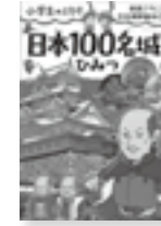
日本100名城のひみつ

長年筋トレを続けている上級者も、自分のレベルに合わせて食事法を見直してみませんか。無理をせず、最高の筋肉を身につけられる方法を紹介。