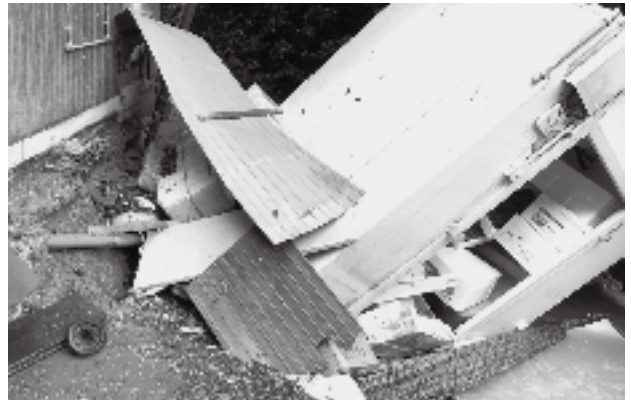
店舗だけではなく業務用冷蔵庫などの設備も被災。