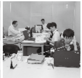
グループ補助金申請に必要な大量の書類。吉田公民館には、中小事業者を支援する窓口が設置された。