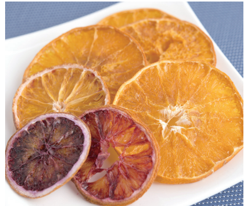
▲色味豊かなドライフルーツ