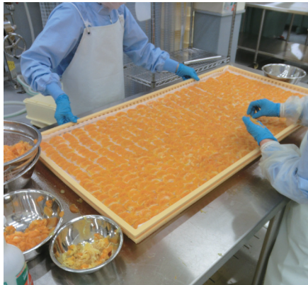
▲手作業で行う皮むきや房わけ