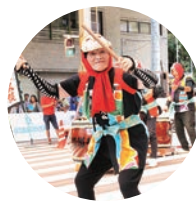
〈パフォーマンス〉 これかた会 (護法太鼓)