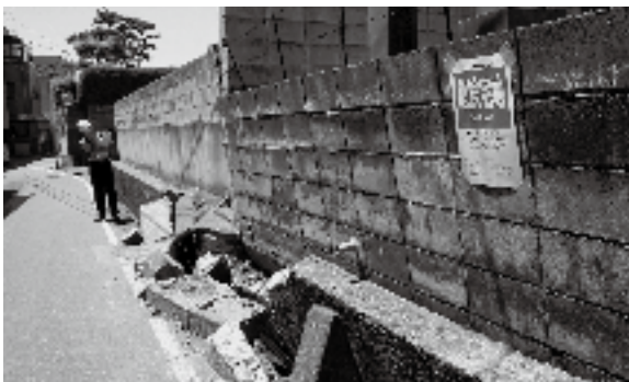
【平成19年新潟中越沖地震による被害】

道路に面したブロック塀などが災害時に倒壊した場合、道路をふさぎ、避難や救助・消化活動を妨げる場合もあります。早めに点検し、災害に備えましょう。