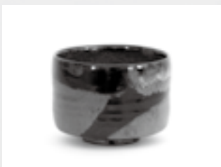
「古薩摩茶碗」 （個人蔵）

電話で申し込みの場合、 受付時間は午前9時～午後 4時30分まで。また、月曜 日は休館日です。 ※定員に達した回は、申し 込みをお断りする場合は あります。