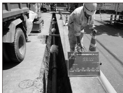
▲第7次整備 耐震直送管を布設