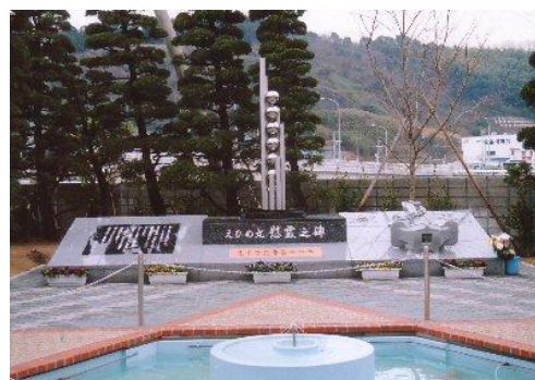
宇和島水産高に建立されている慰霊碑