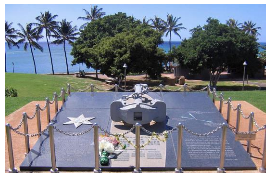
カカアコ・ウォーターフロント・パークに建立された慰霊碑。常時綺麗に管理されており、献花が絶えることが事がない。