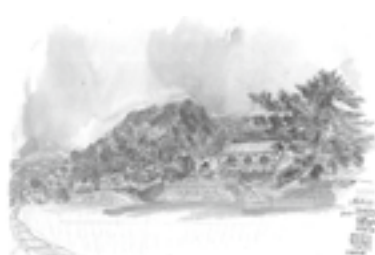
岩松川「岩松文学散歩」表紙より