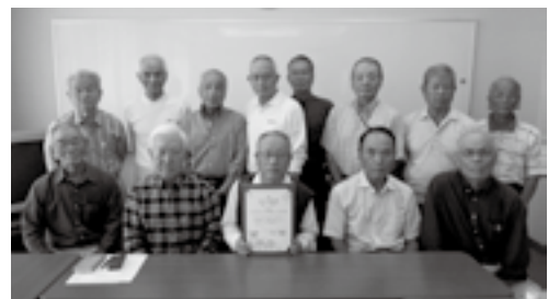
＜市老人クラブ連合会三間支部の皆さん＞