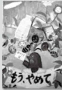
【中学年の部・金賞】 酒井 理帆さんの作品