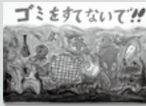
【低学年の部・金賞】 田村 麻衣さんの作品