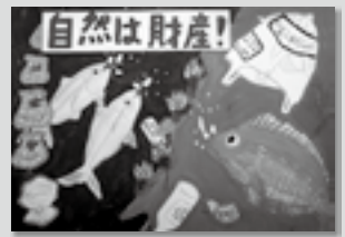
【高学年の部・金賞】 室津 今日子さんの作品