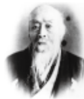
宇和島伊達家 7代藩主 宗紀肖像

長寿大名として名の知れ る7代藩主宗紀。100年 (公式記録) という長い年 月を生きた中、政治家とし て手腕をふるう一方、趣味 の世界でも遺憾なく才能を 発揮しました。今回は、伊 達家に伝来する宗紀所用の 品やその人柄が偲ばれる品 を中心に、1世紀を生き抜 いた長寿大名ゆかりの品を 一挙に公開します。