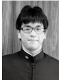
平成24年度全国高等学校 水産・海洋系教育体験発表会 最優秀賞 (平成24年8月3日)