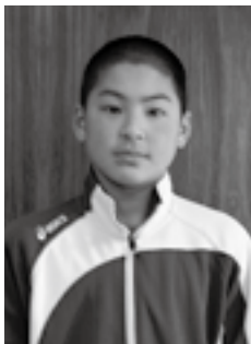
第7回全国ブロック選抜 U-12体操競技選手権大会 男子種目別 跳馬 優勝 (平成24年11月11日)