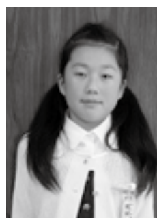
「ふるさとの田んぼと水」 子ども絵画展2012 環境大臣賞 (平成24年12月15日)