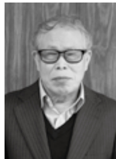
第12回全国障害者スポーツ 大会陸上競技立幅跳 第1位 (平成24年10月15日)