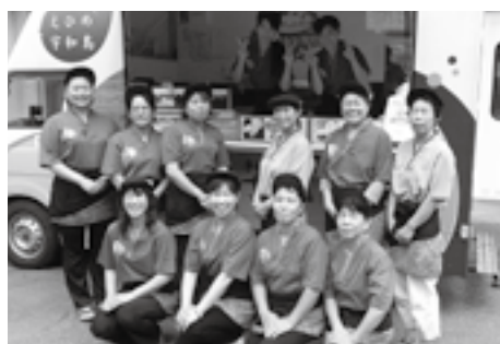
第17回全国青年・女性漁 業者交流大会 農林水産大臣賞 (平成24年3月2日)