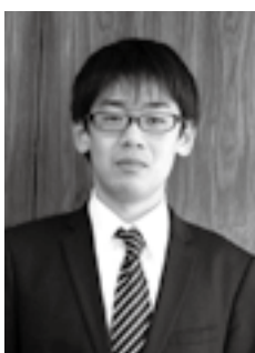
平成24年度全日本通信珠 算競技大会 団体総合競技 一般の部 優勝 (平成24年12月21日)