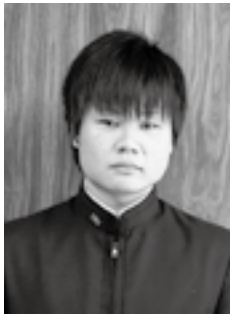
第67回国民体育大会 ボート競技少年男子 舵手つきクオドルブル 第1位 (平成24年10月8日)