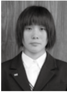
第67回国民体育大会 ボート競技少年女子 舵手つきクオドルブル 第1位 (平成24年10月8日)