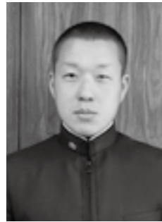
第67回国民体育大会 ボート競技少年男子 舵手つきクオドルブル 第1位 (平成24年10月8日)