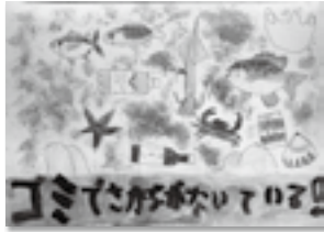
【低学年の部・金賞】 渡邊 椿さんの作品