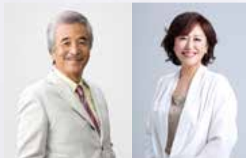
さとつ 宗幸さん 沢田 知可子さん