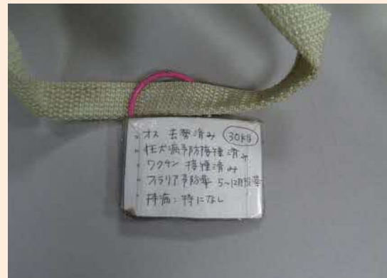
ペット用備蓄品保管袋に付けられた個体情報の例