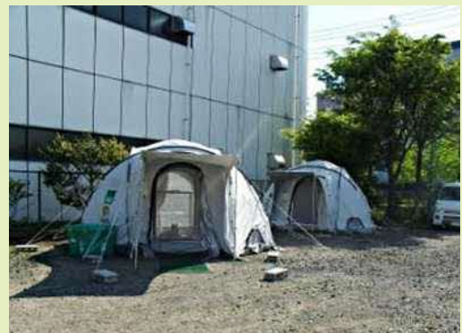
人とペットの同居テント（仙台市）