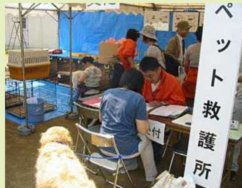
防災訓練におけるペット同行避難訓練の様子（仙台市）