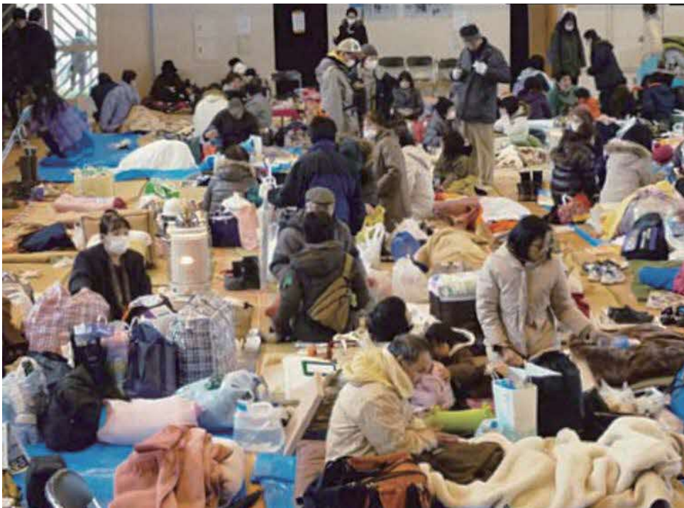
避難所では、周りの人への配慮が必要

また、ペットは、ストレスから体調を崩したり、病気が発生しやすくなるため、飼い主はペットの体調に気を配り、不安を取り除くように努める。