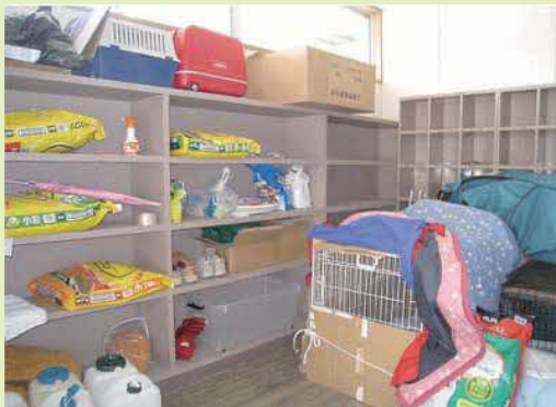
屋内で飼育している様子（岩手県南地域）