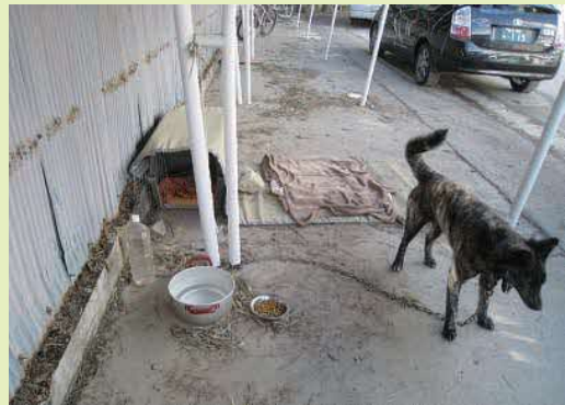
ペット専用係留所で飼育されている様子（岩手県）