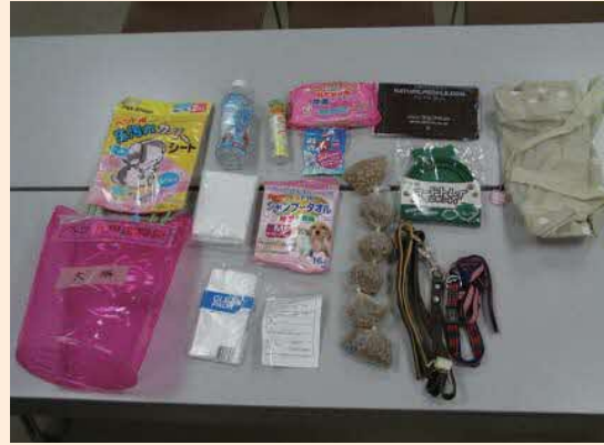
ペット用備蓄品 (犬用) の例