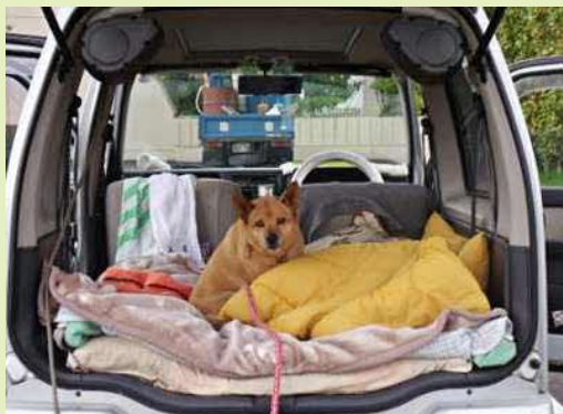
ペットとの車中泊（仙台市）