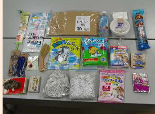
ペット用備蓄品 (猫用) の例