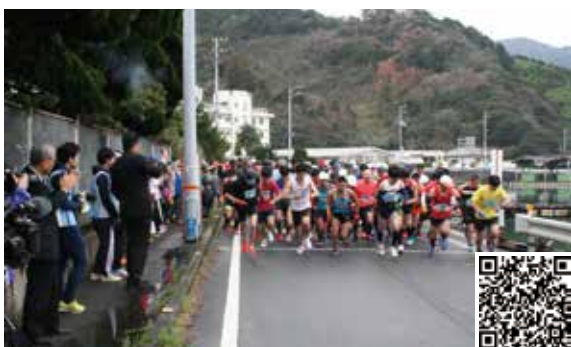
ID : 0530995

問 文化・スポーツ課スポーツ振興係 ☎49-7033 ✉ sports@city.uwajima.lg.jp