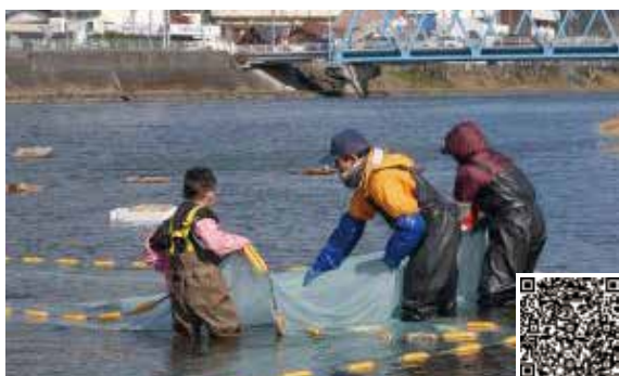
ID : 20240128