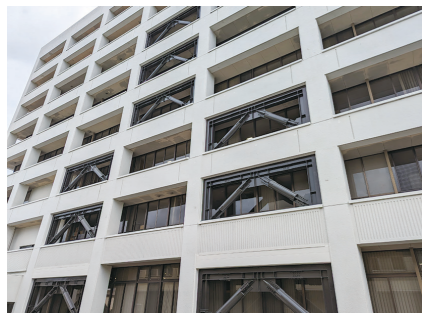
高層棟補強ブレース